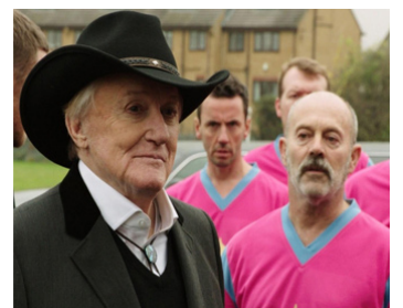
2013 THE MAGNIFICENT ELEVEN de Jeremy Wooding avec Keith Allen