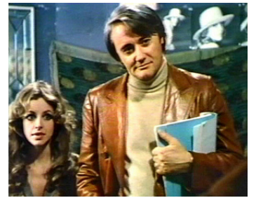
1975 LA BABY-SITTER de René Clément avec Sydne Rome