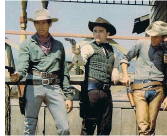
1960 LES 7 MERCENAIRES (The Magnificent Seven) de John Sturges avec J. Coburn, Steve McQueen