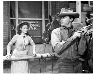
1958 GOOD DAY FOR A HANGING de Nathan Juran avec Joan Blackman