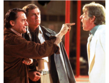
1981 S.O.B. (S.O.B.) de Blake Edwards avec Larry Hagman, Richard Mulligan