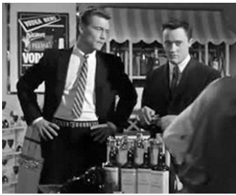
1957 NO TIME TO BE YOUNG de David Lowell Rich avec Laurence Harvey