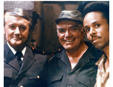
1987 SKELETON COAST de John Bud Cardos avec Ernest Borgnine, Leon Isaac Kennedy