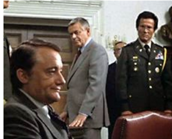
1980 VIRUS (Fukkatsu no hi) de Kinji Fukasaku avec Glenn Ford, Henry Silva