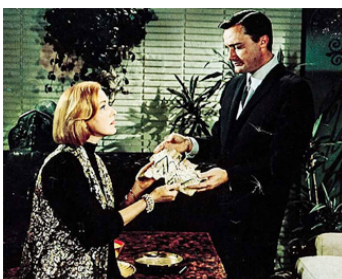
1968 LE MAÎTRE DU MONDE (How to steal the World) de Sutton Royley avec Eleanor Parker