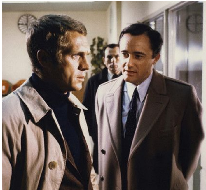
1968 BULLITT (Bullitt) de Peter Yates avec Steve McQueen