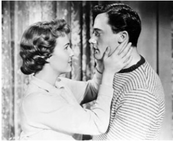
1958 UNWED MOTHER de Walter Doniger avec Norma Moore