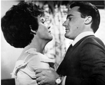
1963 LA CAGE AUX FEMMES (The Caretakers) de Hall Bartlett avec Polly Bergen