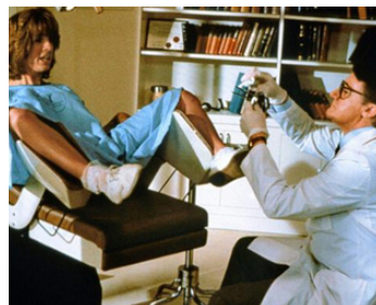
1990 PERSONNE N'EST PARFAITE (Nobody's perfect) de Robert Kaylor avec Chad Lowe