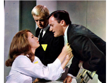
1966 L'ESPION AU CHAPEAU VERT (The Spy with the green hat) de J. Sargent avec Laetitia Roman