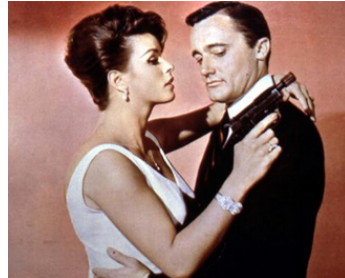
1965 LE MYSTÈRE DE LA CHAMBRE FORTE (The Spy with my face) de J. Newland avec Senta Berger