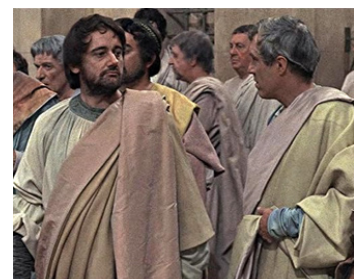
1970 JULES CÉSAR (Julius Caesar) de Stuart Burge avec Jason Robards