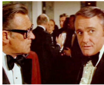
1974 LA TOUR INFERNALE (The Towering Inferno) de John Guillermin avec Paul Newman