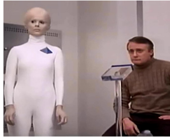
1977 L'INVASION DES SOUCOUPES VOLANTES (Starship Invasions) d'Ed Hunt avec H. Ramer