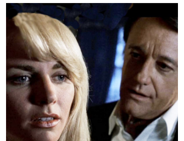
1990 L'EMMURÉ VIVANT (The Buried Alive) de Gérard Kikoïne avec Ginger Lynn Allen