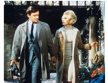
1967 MINUIT SUR LE GRAND CANAL (The Venetian Affair) de Jerry Thorpe avec E. Sommer