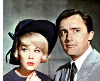
1966 UN ESPION DE TROP (One Spy too many) de Joseph Sargent avec Dorothy Malone