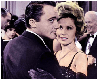
1966 PIÈGE POUR UN ESPION (To trap a Spy) de Joseph Sargent avec Pat Crowley