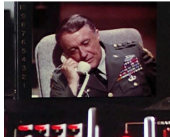
1986 DELTA FORCE (The Delta Force) de Menahem Golan