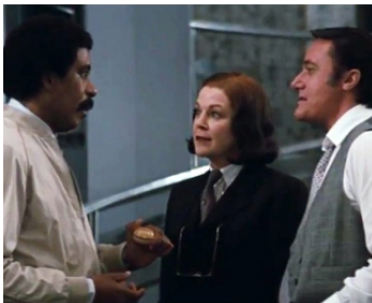
1983 SUPERMAN 3 (Superman 3) de Richard Lester avec Richard Pryor, Annie Ross