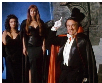
1989 TRANSYLVANIA TWIST de Jim Wynorski avec Teri Copley, Monique Gabrielle