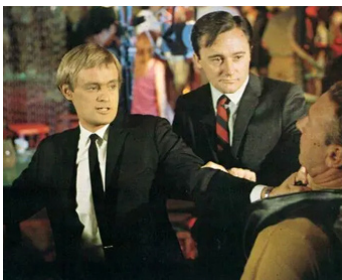
1967 TUEURS AU KARATÉ (The Karate Killers) de Barry Shear avec David McCallum