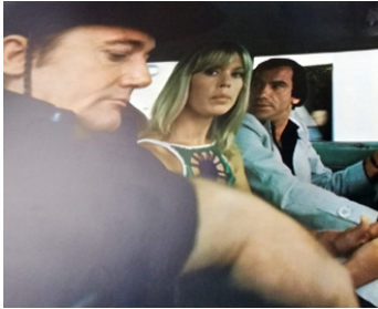
1976 PIÉGÉ DANS LA JUNGLE (Altraco en la jungla) de G. Hessler avec K. Kristine, S. Andreu