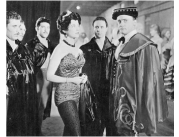
1961 LES ROIS DU CIRQUE (The Big Show) de James B. Clark avec Esther Williams