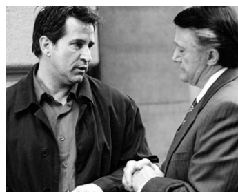
2003 HAPPY HOUR (Happy Hour) de Mike Benchivenga avec Anthony LaPaglia