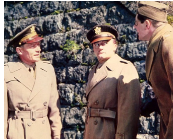
1978 LA CIBLE ÉTOILÉE (Brass Target) de John Hough avec Edward Herrmann