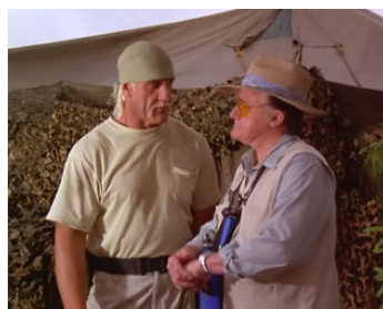
1998 MCCINSEY'S ISLAND de Sam Firstenberg avec Hulk Hogan