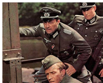
1969 LE PONT DE REMAGEN (The Bridge of Remagen) de J. Guillermin avec Bradford Dillman