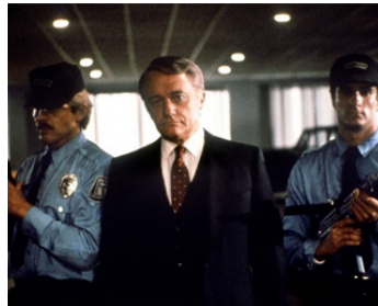
1986 SANS ISSUE (Black Moon Rising) d'Harley Cokliss