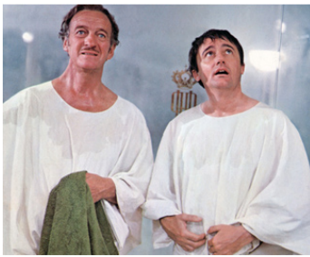
1971 LE PLAISIR DES DAMES (The Statue) de Rod Amateau avec David Niven