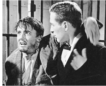
1959 CE MONDE À PART (The Young Philadelphians) de Vincent Sherman avec Paul Newman