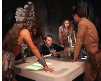
1980 LES MERCENAIRES DE L'ESPACE (Battle beyond the Stars) de J. Murakami avec D. Fluegel