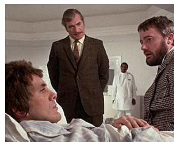
1970 THE MIND OF MR SOAMES d' Alan Cooke avec Terence Stamp, Donald Donnelly