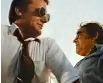
1980 CUBA CROSSING de Chuck Workman avec Michael V. Gazo