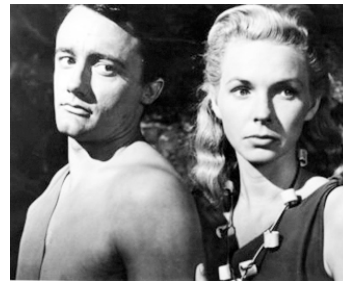
1958 TEENAGE CAVE MAN de Roger Corman avec Darrah Marshall